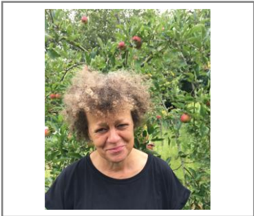
MVR. JO LAND- EN TUINBOUW