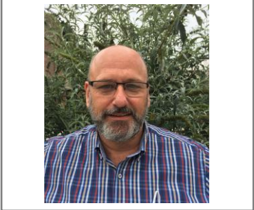
MR. LUC VOEDING EN HORECA