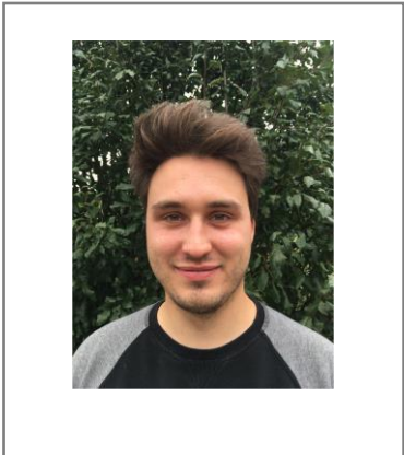
MR. MOONRAY TITULARIS 2A DIGITALE WIJSHEID BURGERSCHAP WETENSCHAPPEN